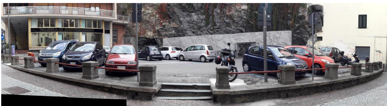
Scalinate e muretto oggetto di intervento

La Piazza con la parete rocciosa, sarà riqualificata con la sistemazione del muretto che delimita l'area con Via Guarnotta, il quale verrà modificato chiudendo la gradinata centrale poco utilizzata dai pedoni con l'ampliamento di quella all'inizio della piazza e verrà infine asfaltata la striscia dell'area dove verranno eseguiti i lavori.