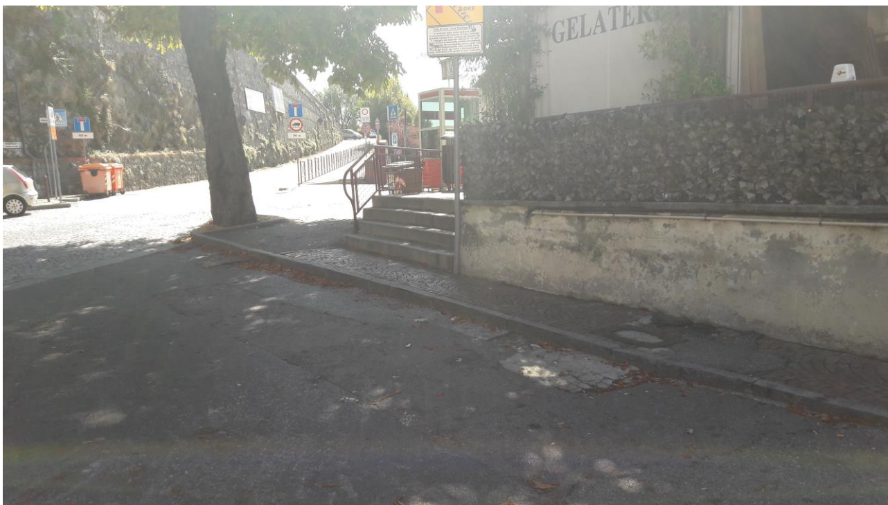
Marciapiede oggetto di intervento