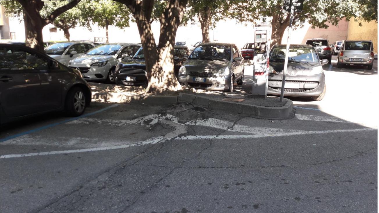
Aree oggetto di intervento

La piazza posta nelle vicinanze del centro storico, verrà interessata da opere di ripristino del manto bituminoso, attualmente logorato dalle radici delle piante al suo interno, verranno ripristinati al meglio i cordoli delle attuali aiuole ed infine gli attuali stalli verranno modificati affinché i veicoli possano parcheggiare più comodamente.