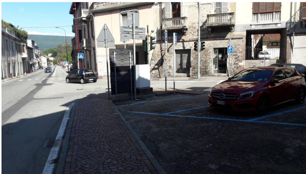
Area oggetto di intervento

Sarà realizzata una piccola isola pedonale, con pavimentazione uguale al marciapiede adiacente di Via Circonvallazione al fine di poter sfruttare al meglio gli spazi attualmente in disuso dell'area oggetto di intervento ed infine verrà riasfaltata.